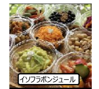
イソフラボンジュール