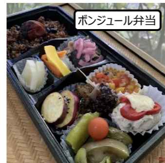
ボンジュール弁当