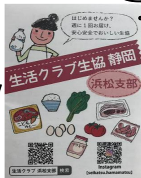
A7サイズ半折りチラシ 7.3×10.5

このチラシはかわいくて機能的。 表にはQR、見開きには生活クラブ の理念と成り立ち。背面には注文・ 配達の流れ。いろんなお店のショッ プカードの中でも目をひく人気者まち がいなし。ぜひお手元に 置いていただいたお店や居場所は、 いずれ紹介させていただきたいです。 チラシご依頼はセンターまで。