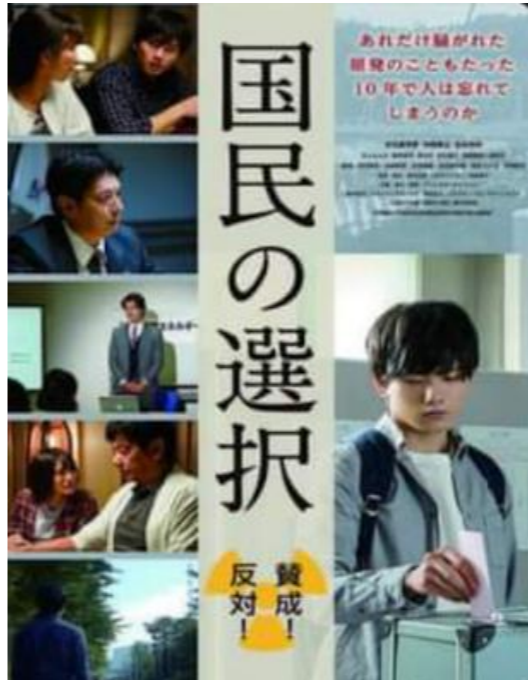
※生活クラブ浜松支部でも年内に自主上映予定

福島原発事故から11年。現在もなお汚染処理水の 問題は進まず、廃炉にはほど遠い。電気を作るための 資源の高騰により原発再稼働へ踏み出す動きが出て いる。私たちの今の生活は電気抜きには成り立たな い。この映画は私たちの未来に原発に頼るか脱する かを国民に問うフィクションだ。どのような未来を残 したいか向き合うきっかけになるだろう。